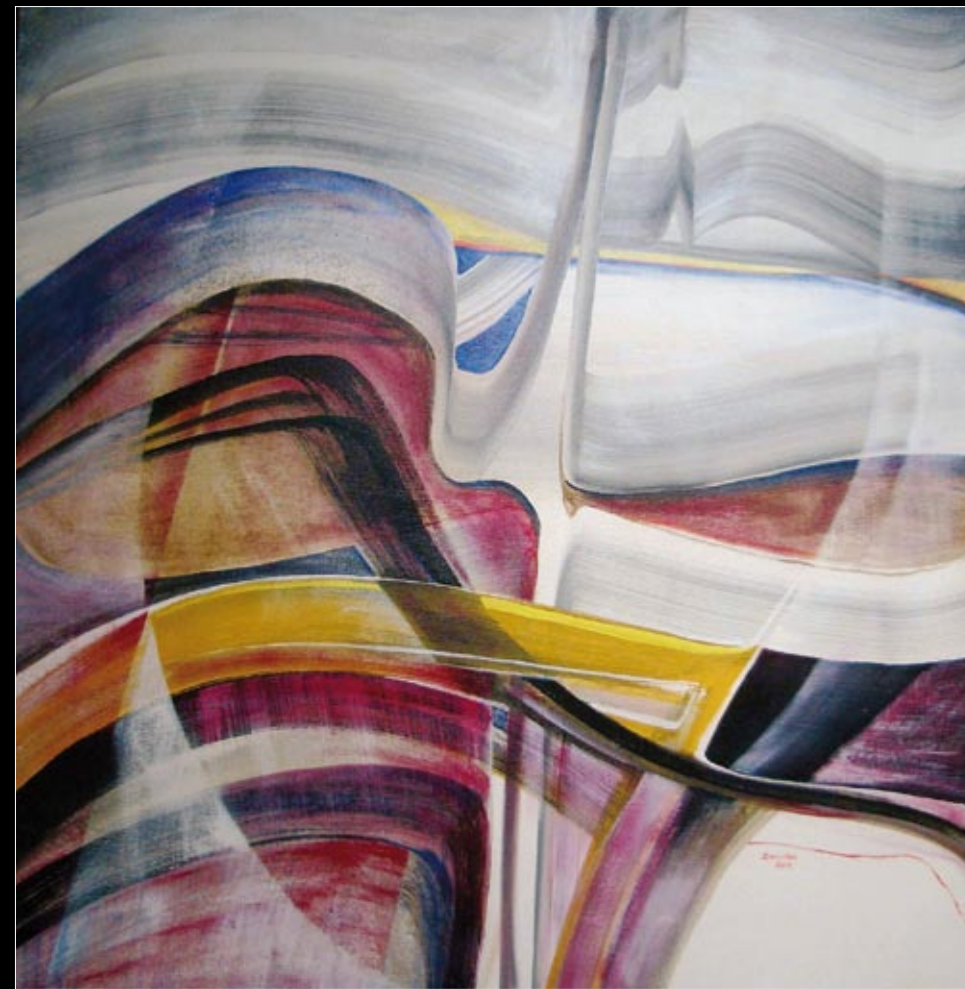
Two Mood Songs

kraška hiša _ galleria carsica _ repen 29.4. _ 25.5.2011