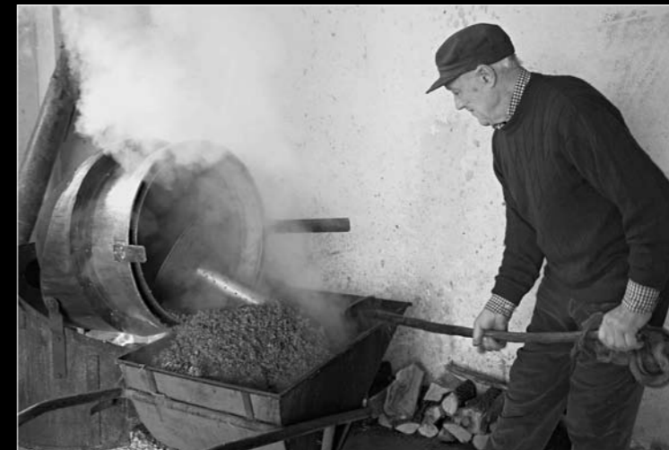
MIROVO ŽGANJE _ LA GRAPPA DI MIRO Renata Deganello